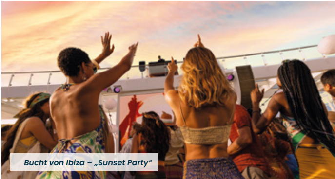
Bucht von Ibiza – „Sunset Party“